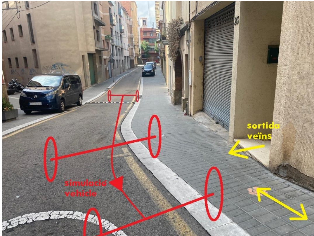
Visió direcció Carretera Barcelona

La problemàtica en aquest punt, és que els vehicles quan tracen la corba envaeixen la vorera, molts d'ells ho van perquè esquiven el ressalt (badén) que hi ha uns metres abans del canvi de rasant, altres per la proximitat de la zona de càrrega i descarrega i sense tenir en compte, els que tenen una conducció temerària. En aquest punt s'han produït diferents ensurts tant amb els veïns que surten de la porteria número 23, com els vianants que estan per sobre del canvi de rasant. La perillositat es multiplica si el vehicle no respecta la limitació de 30 km/h.