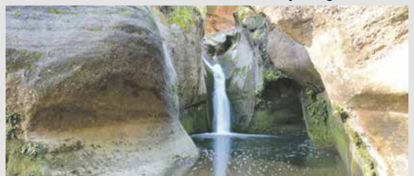
La Mola.

municipi. El context està marcat per l'emergència climàtica, que ens obliga a estar atents i actuar pel que fa a la preservació i manteniment d'aquestes zones. Aquest acord implica la protecció i preservació institucional dels espais naturals, l'elaboració d'una ordenança verda i un procés de participació ciutadana que suggerirà espais sensibles i formes de protegir-los.